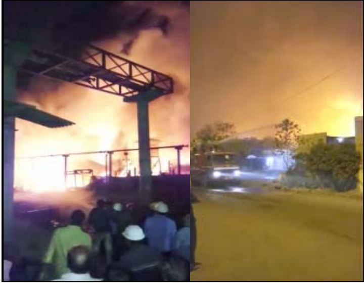
અંકલેશ્વરની સન ફાર્મા કંપનીમાં ભીષણ આગ ફાટી નીકળી હતી.