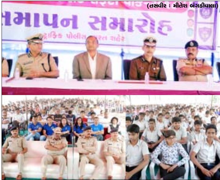
દ્વારિક સપ્તાહની પૂજાહૃતિ નિમિત્તે પોલીસ પેડે ગ્રાઉન્ડ ખાતે સમાપન કાર્યક્રમ યોજાયો હતો.