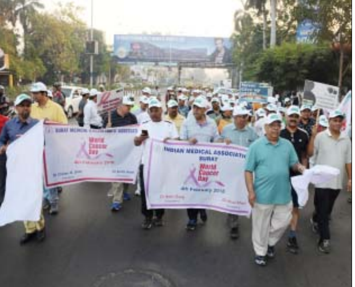
વર્લ્ડ કેન્સર ડે નિમિત્તે ઈન્ડિયન મેડિકલ એસોસિએશન દ્વારા ઝઠવાલાઈલ્સ ચોપાટી ખાતે બેનરો સાથે રેલી યોજાઈ હતી.