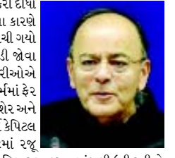
અનુ. પાના ૭ પર

લોંગ ટર્મ કેપિટલ ગેઈન ટેક્સ દરખાસ્ત પાછી નહીં ખેંચાય : જેટલી નાણામંત્રી અને સંબંધિત વિભાગના વડાઓએ સાફ ઈન્કાર કરી દીધો છે. નાણામંત્રી અરુણ જેટલી અને કેન્દ્ર સરકારના અન્ય સંબંધિત વિભાગના વડાઓએ લોંગ ટર્મ કેપિટલ ગેઈન ટેક્સ પર દરખાસ્તમાં ફેરવિયારણા કરવાનો સાફ ઈન્કાર કરી દીધો છે. લોંગ ટર્મ કેપિટલ ગેઈન ટેક્સના કારણે શેરબજારમાં હાલમાં ભારે હોબાળો મચી ગયો હતો. શેરબજારમાં ભારે અફડાતફડી જોવા મળી હતી. વરિષ્ઠ સરકારી અધિકારીઓએ કહ્યું છે કે, એલટીસીજી ટેક્સના સંદર્ભમાં ફેરવિયારણા કરવાનો કોઈ પ્રશ્ન નથી. શેર અને ઈક્વિટી મ્યુચુઅલ ફંડ ઉપર લોંગ ટર્મ કેપિટલ ગેઈન ટેક્સ લાગુ કરવાની બજેટમાં રજૂ કરવામાં આવેલી દરખાસ્ત ઉપર ફેરવિયારણા કરવા માંગણી ઉઠી રહી છે ત્યારે આ સંદર્ભમાં ધ્યાન આપવાનો ઈન્કાર કરી દેવામાં આવ્યો છે. અધિકારીઓનું કહેવું છે કે, મિલકત કલાસ માટે ટેક્સ છુટાછાટોના પરિણામ