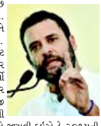
અનુ. પાના ૭ પર

મોદી દેશના પ્રથમ વડાપ્રધાન, જેની વાતોમાં વજુદ નથી : રાહુલ ન્યુ દિલ્હી, તા. ૪ કોંગ્રેસ અધ્યક્ષ રાહુલ ગાંધીએ નવા શાંતિ કરારના બહાને વડાપ્રધાન નરેન્દ્ર મોદી પર આકાર પ્રહારો કર્યા છે. કોંગ્રેસ અધ્યક્ષ એ કહ્યું છે કે નરેન્દ્ર મોદી દેશના પહેલાં એવા વડાપ્રધાન છે જેમની વાતોનો કોઈ મતભલ હોતો નથી. રાહુલ ગાંધીએ રવિવારના રોજ ટ્વીટ કરીને નવા કરારના અસ્તિત્વ પર પ્રશ્નો ઉઠાવ્યા. કોંગ્રેસ અધ્યક્ષ એ ટ્વીટ કરી કે ઓગસ્ટ ૨૦૧૫માં બિસ્તર મોદી એ નવા કરાર પર દસ્તાવેજ કરીને ઈતિહાસ રચવાનો દાવો કર્યો હતો. ફેબ્રુઆરી ૨૦૧૮માં પણ નવા કરાર જમીન પર ક્યાંય દેખાઈ રહ્યો નથી. મોદીજી પહેલાં એવા ભારતીય વડાપ્રધાન છે જેમની વાતોનો કોઈ અર્થ જ નથી થતો. આપને જણાવી દઈએ કે ૨૦૧૫ની સાલમાં કેન્દ્ર સરકાર એ નવા અલગવાવાદી સંગઠન નેશનલ સોશ્યાલિસ્ટ