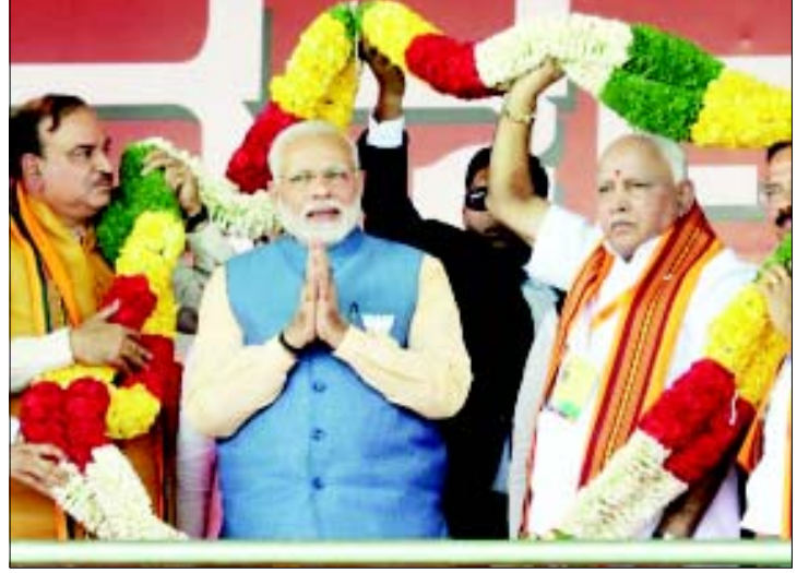
વડા પ્રધાન નરેન્દ્ર મોદીએ રવિવારે બેંગલુરુમાં પેલેસ ગ્રાઉન્ડ ખાતે ભાજપનો ૯૦-દિવસનો નવનિર્માણ પલિવર્તન યાત્રાના સમાપન નિમિત્તે આયોજિત એક બાહેર સભાને સંબોધિત કરી હતી. બાહેર સભામાં ભાજપના કળાટક એકમના પ્રમુખ બી.એસ. ચૌહાણે આરોહીને પર્વરાગત પાઘડી પહેરાવીને એમનું સ્વાગત કર્યું હતું.

ભારતમાં રહેનાર બધા રામના સંતાન : ગિરિરાજ સિંહ ન્યુ દિલ્હી, તા. ૪ પોતાના નિવેદનોને લઈને હંમેશા ચર્ચાનો વિષય બનનારા ભારતીય જનતા પાર્ટીના નેતા અને કેન્દ્રિય મંત્રી ગિરિરાજ સિંહે ફરી એકવાર વિવાદાસ્પદ નિવેદન આપ્યું છે. સિંહે કહ્યું છે કે, ભારતમાં રહેતા તમામ રામના સંતાનો છે, અહીં કોઈ ભાવરનો વંશજ નથી. રામ મંદિરના સંદર્ભમાં ગિરિરાજ સિંહે કહ્યું હતું કે, ભારતની અંદર કોઈ પણ ભાવરના વંશજ નથી. અહીં બધા રામના સંતાનો છે, રામના પરિવારમાંથી છે. જો હું ધર્મ પરિવર્તન કરી લઉં તો શું મારા બાળકો અને તેમની આવનારી પેઢીઓ ના પૂર્વજ બદલાઈ જશે ના, તેઓ હિન્દુ જ રહેશે.