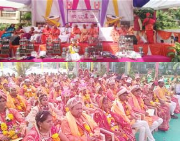
શ્રી સ્વામિનારાયણ જ્ઞાન પીઠ સલવાવ દ્વારા ૧૧મો સમૂહ લગ્નોત્સવ યોજાયો હતો.